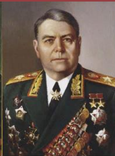
Маршал А. М. Василевский