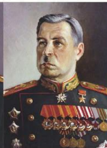
Маршал Л. А. Говоров