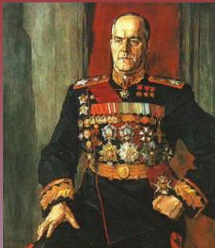
Маршал Г. К. Жуков