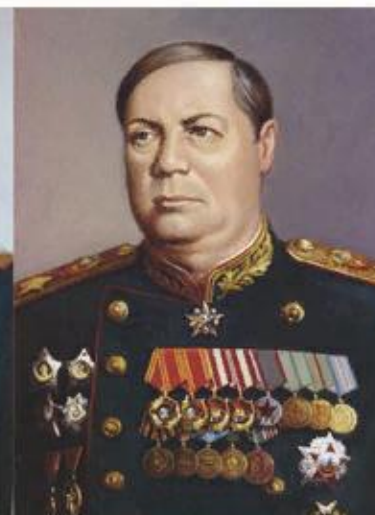
Маршал Ф. И. Толбухин