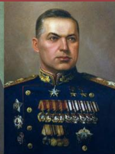
Маршал К. К. Рокоссовский