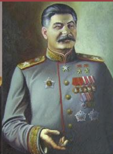
Генералиссимус И. В. Сталин