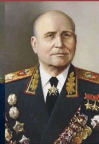
Маршал И. С. Конев