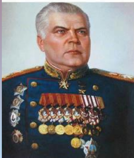
Маршал Р. Я. Малиновский