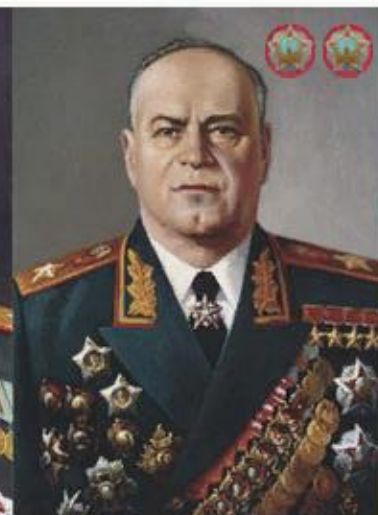
Маршал Г. К. Жуков