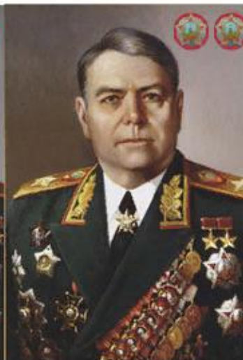
Маршал А. М. Василевский