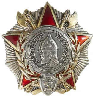
Орден Александра Невского СССР

Русские люди свято чтят заслуги князя Александра Невского перед Отчеством. Орден его имени являлся одной из высших наград Российской империи с 1725 по 1917 год. Петр I намеревался учредить его в качестве награды за ратные подвиги. Но Екатерина I использовала его для награждения гражданских лиц. В начале XX века этот орден был традиционной наградой государственным деятелям, которые посвятили служению России не один десяток лет.