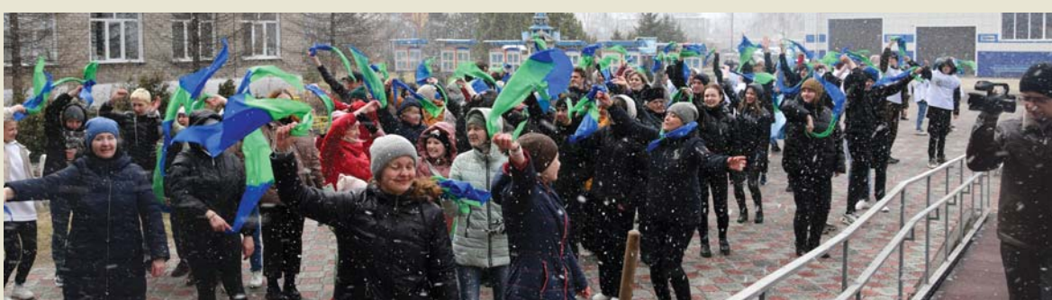
И снег, и ветер не испугали участников заключительного флешмоба на фестивале