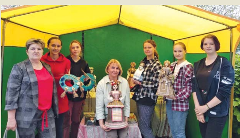
У белорусских мастериц замечательные куклы