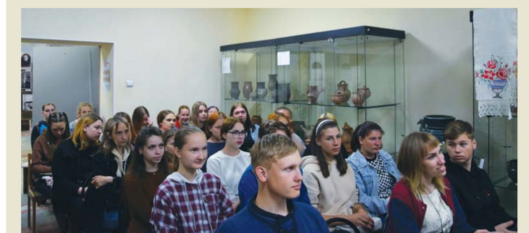
Встречи в музейных залах – это незабываемые уроки об истории края

встречи в музейных залах – это незабываемые уроки об истории края