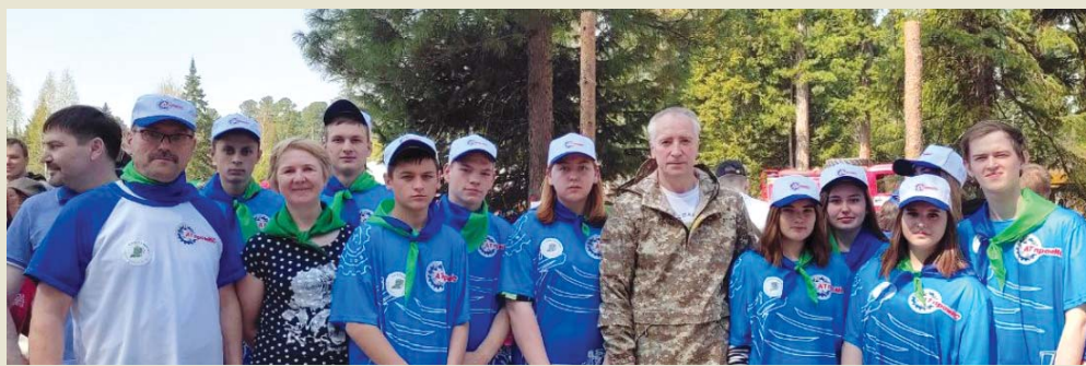
«Сад памяти» объединил руководителей региона, организаций СПО и студентов

Для участников акции была организована полевая кухня, выступили с праздничной программой коллективы СПО, работала фотозона.