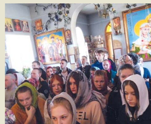
Для многих студентов это первая служба в Храме