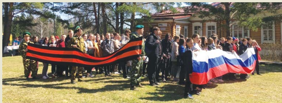
Святость и патриотизм – едины

Постоянными посетителями усадьбы давно стали студенты АТпромИС. Всякий раз им предлагают увлекательные познавательные и развлекательные программы.