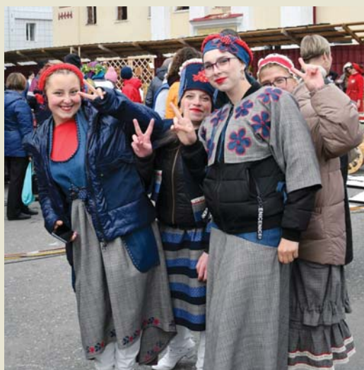
Наряды по сезону к лицу студенткам АТпромИС