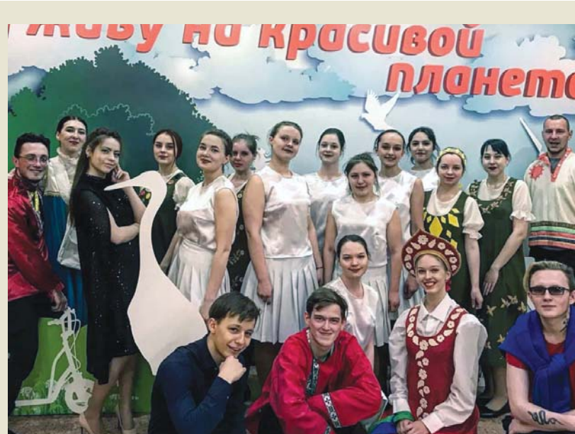
На фестивале «Я живу на красивой планете»