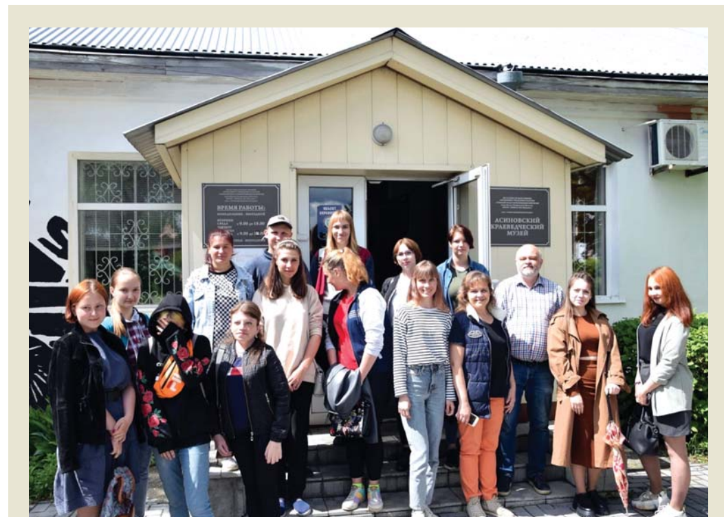
В АРТ-РЕЗИДЕНЦИИ студенты получили советы опытных журналистов

«Арт-резиденция проектируется как постоянно действующая творческая лаборатория, участники которой будут собирать воспоминания, впечатления, семейные предания в музейные истории и воплощать их в проектах выставок, инсталляций, культурно-образовательных программах и музейных акциях», – говорится в сообщении от инициаторов проекта.