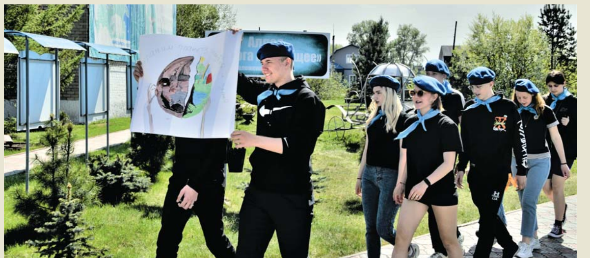
Победный марш «Экодезента» из школы №1