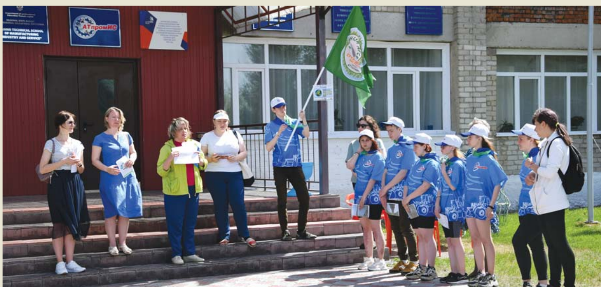
Команда АТпромИС на открытии «Марша»