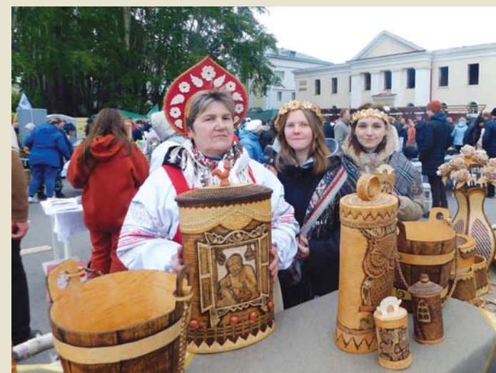
Выставочный ряд мастера С.М. Масанкиной