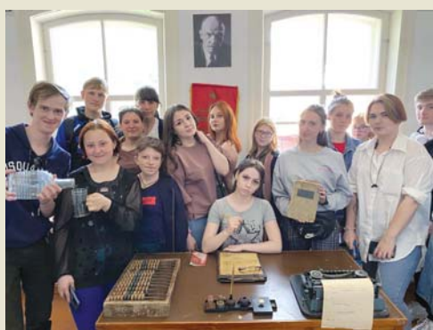
Всё, как в прошлом веке