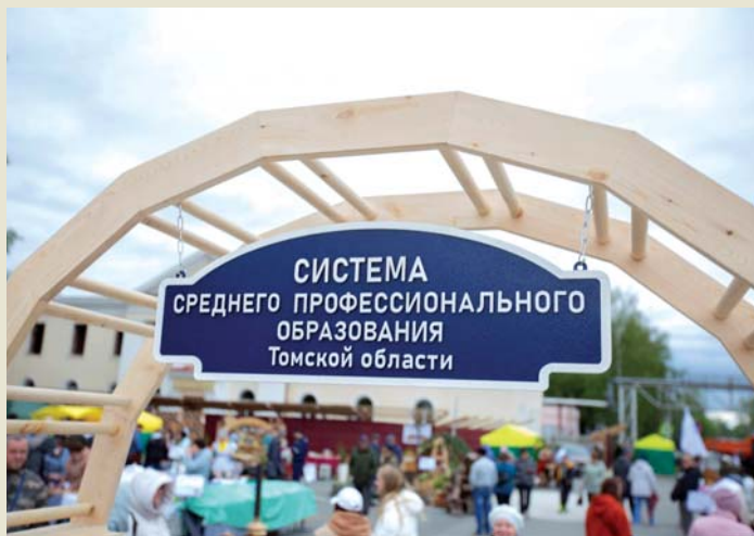
Вход на территорию СПО