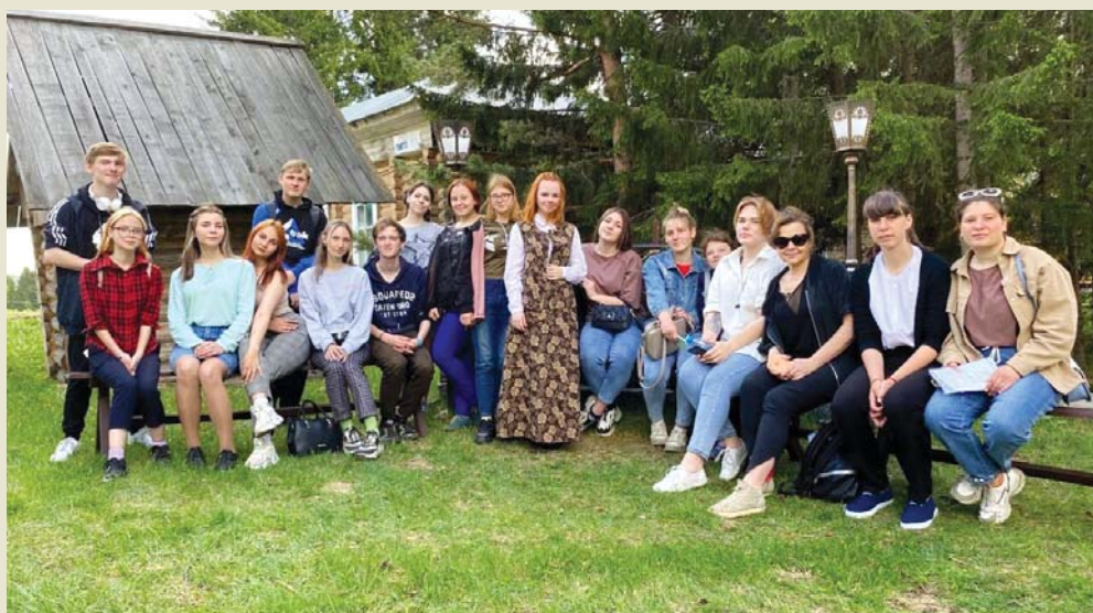
Отдых под сенью вековых елей