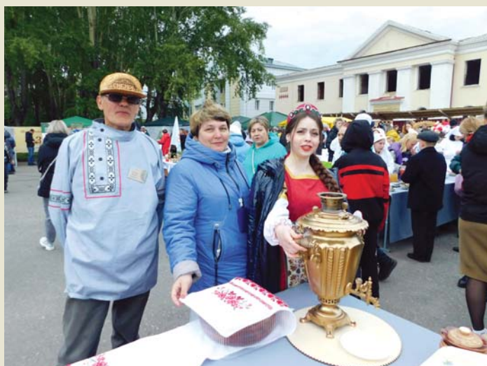
Гостеприимство – добрая традиция коллектива техникума