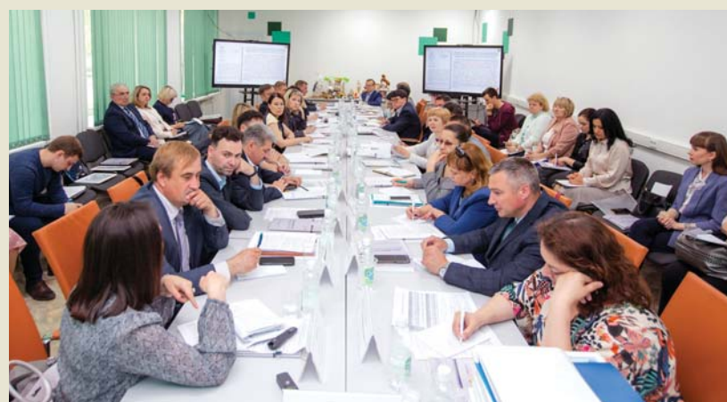
Заседание совета директоров СПО

Ещё на совещании обсуждали реализацию регионального проекта «Патриотическое воспитание граждан Российской Федерации» и увеличение охвата студентов, вовлеченных в мероприятия и проекты патриотической направленности, а также орга-