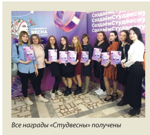
Все награды «Студвесны» получены

В Томской области популярен Всероссийский фестиваль «Студенческая весна» – уникальный проект в сфере творчества студенческой молодёжи России. Ежегодно томские ребята готовят творческие программы и индивидуальные номера в разных направлениях. Это требует большой самоотдачи, дисциплины, умения работать в команде и, конечно таланта. Творческая программа Асиновского техникума промышленной индустрии и сервиса называлась «В начале было Слово». Её делегация АТпромИС показала на грандиозном мероприятии в системе среднего профессионального образования – Гала-концерте по итогам регионального этапа Российской «Студвесны».