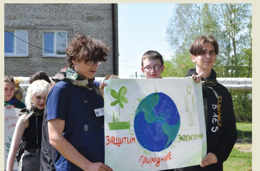
Плакат – действенный агитационный материал