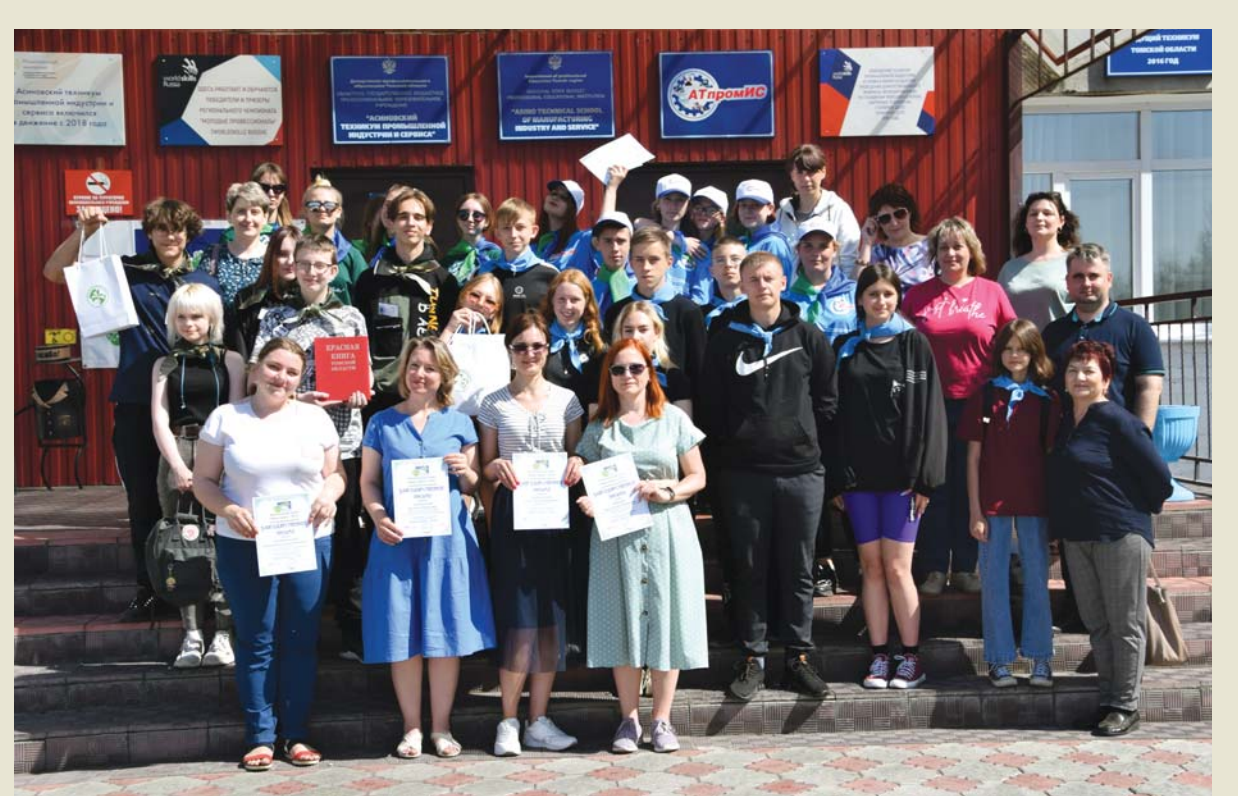
Все участники «Марша парков» в сборе