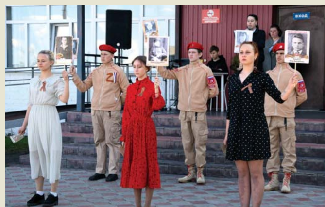
День Победы – праздник всех поколений

Материалы полосы подготовлены Медиа-центром АТпромИС