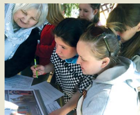
Отвечали, в чём подвиг Георгия Победоносца