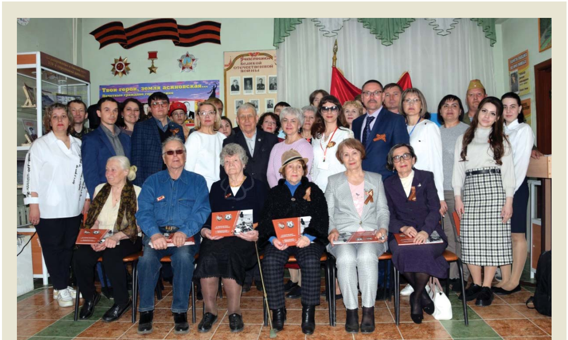
Участники памятного события в честь 100-летия Е.А. Глухих