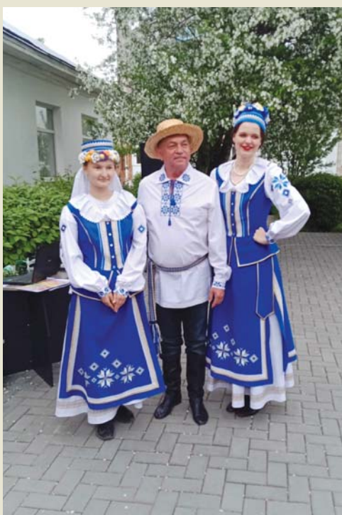
Национальный белорусский наряд всем к лицу