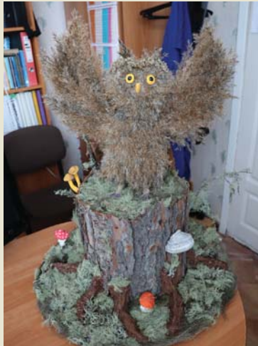
Подделка, Анжелика ЛОБАНОВА