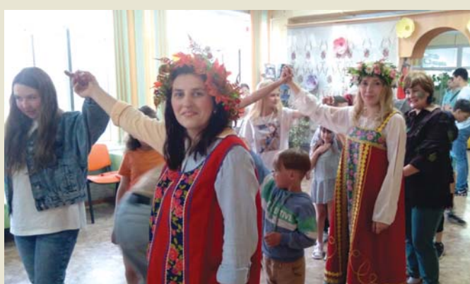
Вспомнили игру «Ручеек»

зыка и песни в исполнении педагогов и учеников Асиновской ДШИ. Под занавес акции подростки попросили устроить им дискотеку под народные песни, которые так раззадорили танцоров, что те задержались на этой площадке после её официального закрытия.