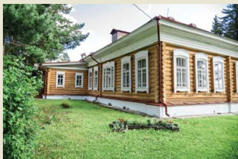
Современный вид дома-музея на усадьбе Н.А. Лампсакова