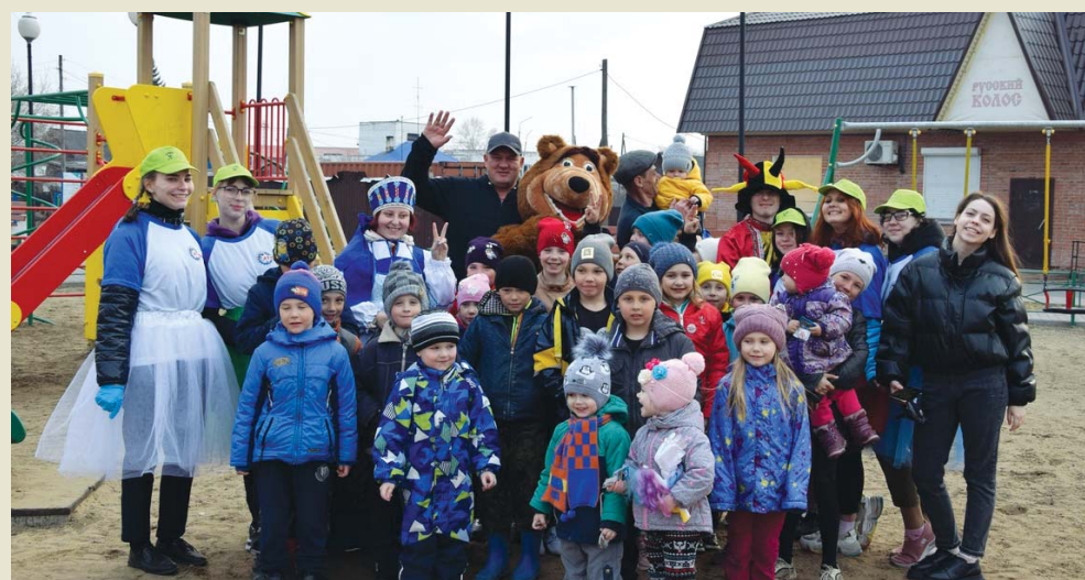
Малышам радостно, когда рядом с ними старшие друзья

Ребята из студсовета и Little-совета техникума желанные гости на городских детских площадках. Очередной раз они побывали у малышей и провели игры на экологическую тему и показали театрализованное представление «В начале было Слово», ко-