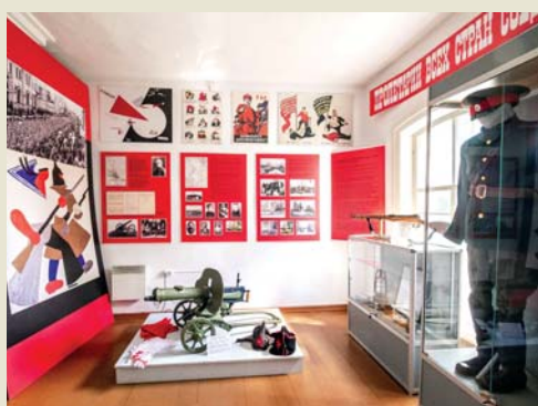
В историческом интерьере музея Гражданской войны