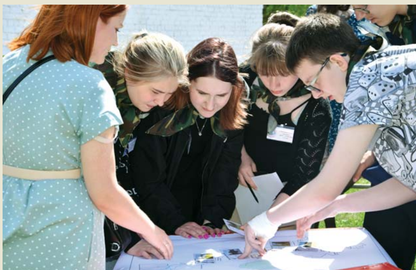
Команда «Экологический спецназ» из школы №4 заняла 2 место