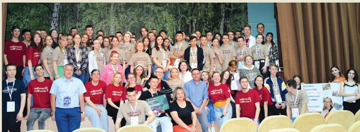
Финальная встреча в «Кадровой школе»

– Моё впечатление о «Кадровой школе» очень положительное. Я являюсь первокурсницей, но уже стала секретарём и руководителем творческого направления «Littlesovet» и для меня было очень много нового, много полезной и интересной информации. Это: безусловно новые знакомства, большой опыт коммуникабельности, заряд энергии и получение новых эмоций. Я считаю, что данное мероприятие мне пошло на пользу и в дальнейшем в моей работе будет прогресс!