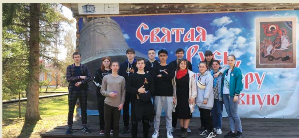
Участвовали в Престольном празднике