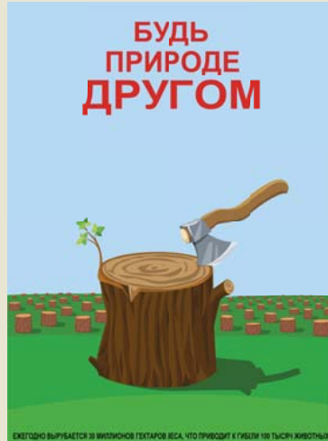
Плакат, Александр МАРЧЕНКО