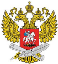
МИНИСТЕРСТВО ПРОСВЕЩЕНИЯ РОССИЙСКОЙ ФЕДЕРАЦИИ